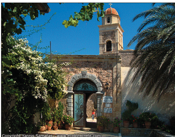
Η πύλη εισόδου της Μονής Τοπλού

Η Μονή ήταν στο απόγειο της δόξας της στα μέσα του 14ου και 15ου αιώνα κρίνοντας από τις πολύ σημαντικές εικόνες τις περιόδους εκείνης. Οι εικόνες αυτές αντιπροσωπεύουν την ανάπτυξη της βυζαντινής αγιογραφίας η οποία επηρέασε την Κρήτη σταδιακά μετά την κατάκτηση της Κωνσταντινούπολης από τους Τούρκους. Η υψηλή εικαστική αξία των εικόνων είναι ενδεικτική του υψηλού επιπέδου της παιδείας των Μοναχών της Μονής, που διαδραμάτισαν σπουδαίο ρόλο στην άνοδο του πολιτισμικού επιπέδου της Αναγεννησιακής Κρήτης στα χρόνια της Ενετοκρατίας. Στη Μονή φυλάσσονται πολύ σπουδαίες και παμπάλαιες εικόνες, όπως η «Μέγας ει Κύριε» του Ιωάννη Κορνάρου (1770), το «Ρόδον το Αμάραντον» (1771), της Αγίας Αναστασίας και της Παναγίας (η οποία βρέθηκε σε κοντινή σπηλιά όπου τρέχει νερό – αγίασμα), ενώ υπάρχουν και αρκετές καλοδιατηρημένες τοιχογραφίες του 14ου αιώνα.