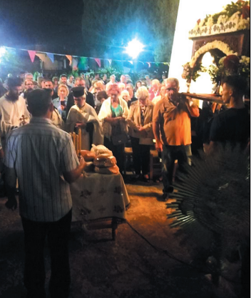
Επιτάφιος του Δεκαπενταύγουστο στο πάνω χωριό