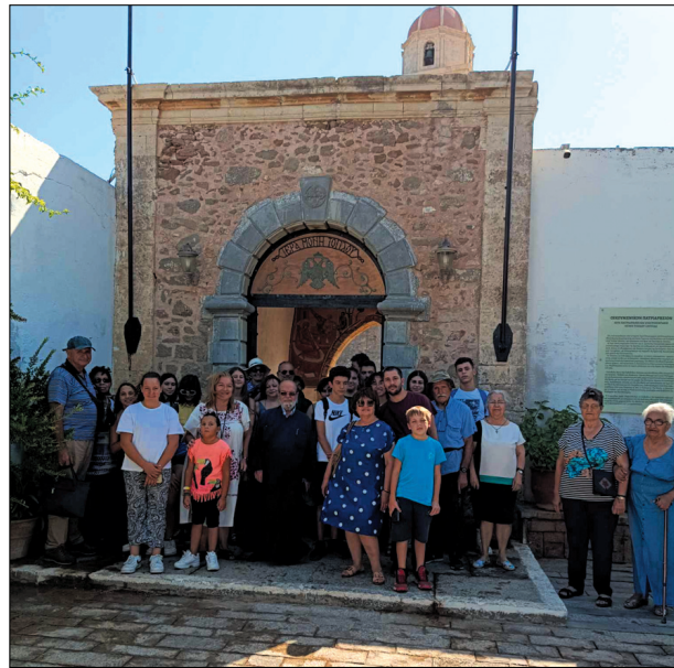
Οι εκδρομείς μπροστά στην πύλη εισόδου της Μονής Τοπλού

Στο διάβα της ιστορίας της η Μονή υπέφερε πολλά. Σεισμοί, λεηλασίες, πόλεμοι κι επαναστάσεις, όμως δεν κατάφεραν να τη λυγίσουν. Οι μοναχοί, παρά τον βαρύ φόρο αίματος που πλήρωναν κάθε φορά, συνέχιζαν να επιτελούν σπουδαίο κοινωνικό και φιλανθρωπικό έργο σ' ολόκληρη την περιοχή. Ακόμα και στην περίοδο της Γερμανικής κατοχής, η Μονή υπήρξε καταφύγιο των αγωνιστών της εθνικής αντίστασης. Ο Ηγούμενος και οι Πατέρες φιλοξενούσαν συμμαχικό ασύρματο, που επικοινωνούσε με το συμμαχικό στρατηγείο του Κάιρου. Στα νεότερα χρόνια αξίζει να σημειωθεί ότι οι μοναχοί με αγάπη και χωρίς φόβο βοήθησαν και περιέθαλψαν τους λεπρούς από την Σπιναλόγκα.