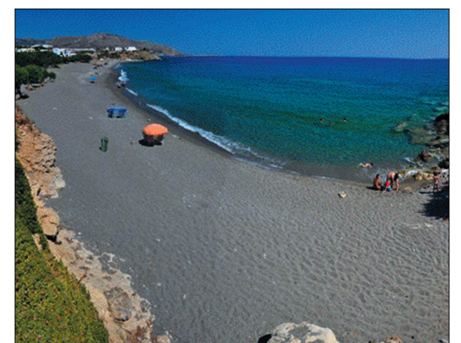
Άποψη του Μακρού Γιαλού

Και στην άλλη με το καλό, που λέμε και στο χωριό μας!