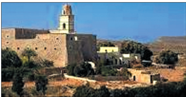
Άποψη της Μονής Τοπλού

Πρώτη στάση για να καφέ και ξεκούραση στην πανέμορφη Σητεία. Κουραστικές είναι η αλήθεια οι στροφές για να φτάσει κάποιος, όμως η ανατολικότερη πόλη της Κρήτης σε μαγεύει με την πρώτη ματιά. Η πατρίδα του Βισσέντζου Κορνάρου ποιητή του Ερωτόκριτου είναι μια γραφική πόλη χτισμένη αμφιθεατρικά προς τον λόφο πίσω της, πάνω στη θάλασσα στην δυτική πλευρά του κόλπου της Σητείας. Στην κορυφή του λόφου βρίσκεται το εντυπωσιακό βενετσιάνικο κάστρο Καζάρμα (Casa di Arma), καλοδιατηρημένο και επισκέψιμο, με θαυμάσια θέα σε όλη την γύρω περιοχή. Η Σητεία διαθέτει αεροδρόμιο και λιμάνι, με τον παραλιακό δρόμο με τους χαρακτηριστικούς φοίνικες να είναι ιδανικός για χαλαρή βόλτα.