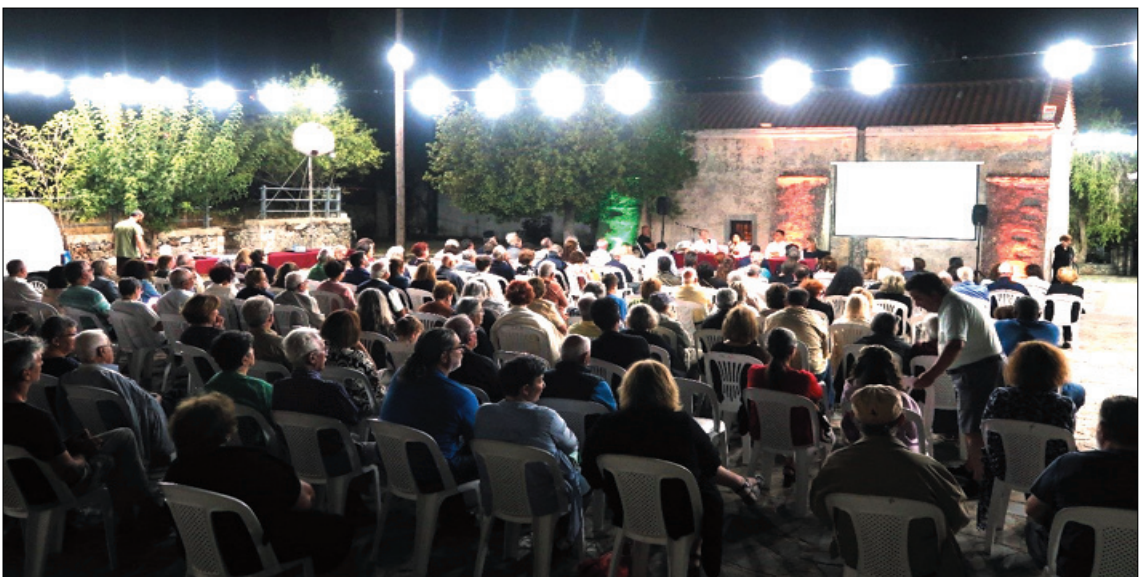
Κατάμεστος ο αύλειος χώρος του Δημοτικού Σχολείου κατά την εκδήλωση