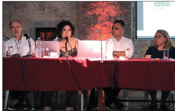
Το πάνελ των παρουσιαστών

Το εκχύλισμα χαρουπιού βρίσκεται σε πολλά προϊόντα περιποίησης του δέρματος και φάρμακα. Χρησιμοποιείται κυρίως στα καλλυντικά.